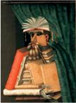
Le Libraire (Wolfgang Lazius) , appelé aussi Le Bibliothécaire 1566, huile sur toile, 97 x 71 cm, Palais Skokloster, Stockholm, Suède.

Giuseppe Arcimboldo est un peintre italien de la fin de la Renaissance (courant appelé maniérisme qui annonce le mouvement baroque) qui fut formé à Milan, avant d'être nommé peintre officiel à la cour des Habsbourg à Vienne, en Autriche. Ses tableaux les plus célèbres sont des portraits anthropomorphes* (qui utilisent des végétaux, des animaux ou des objets pour former des personnages) et allégoriques* (qui utilisent un personnage ou un animal pour illustrer une idée abstraite comme l'amour, la mort...).