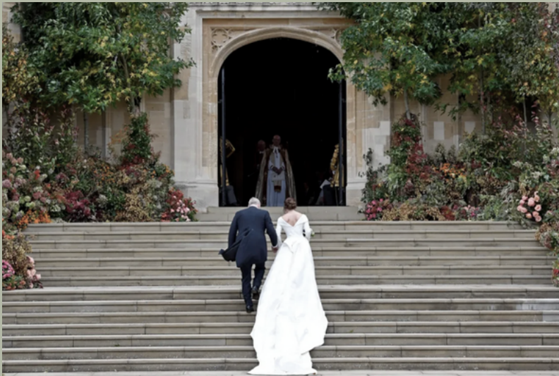
La princesse Eugénie et son père, le Prince Andrew, Duc d'York, montant les marches de la chapelle Saint-Georges avant le mariage, 12 octobre 2018