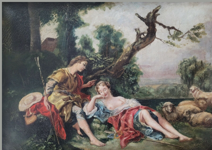
François BOUCHER, La Bergère Endormie , 1743, huile sur toile, 88 x 115 cm, Assemblée nationale, Paris

C'est en visitant la Wallace Collection, à Londres, que Vivienne Westwood puise son inspiration pour sa collection. Elle choisit l'œuvre La Bergère Endormie (1743) du peintre décoratif François Boucher qu'elle imprime ensuite sur une série de corsets. Cette collection deviendra iconique, à tel point que ses corsets sont encore portés aujourd'hui par la mannequin Bella Hadid ou l'artiste FKA Twigs.