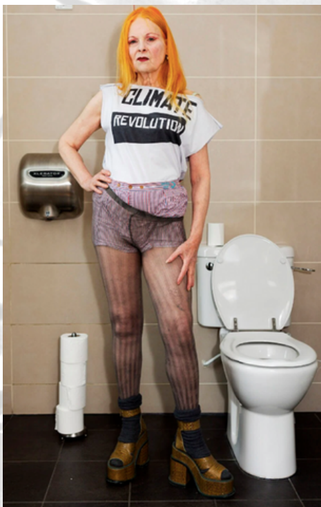
Martin PARR, Vivienne Westwood , 2012, photographie, 15,28 x 10,52 cm, National Portrait Gallery, Londres