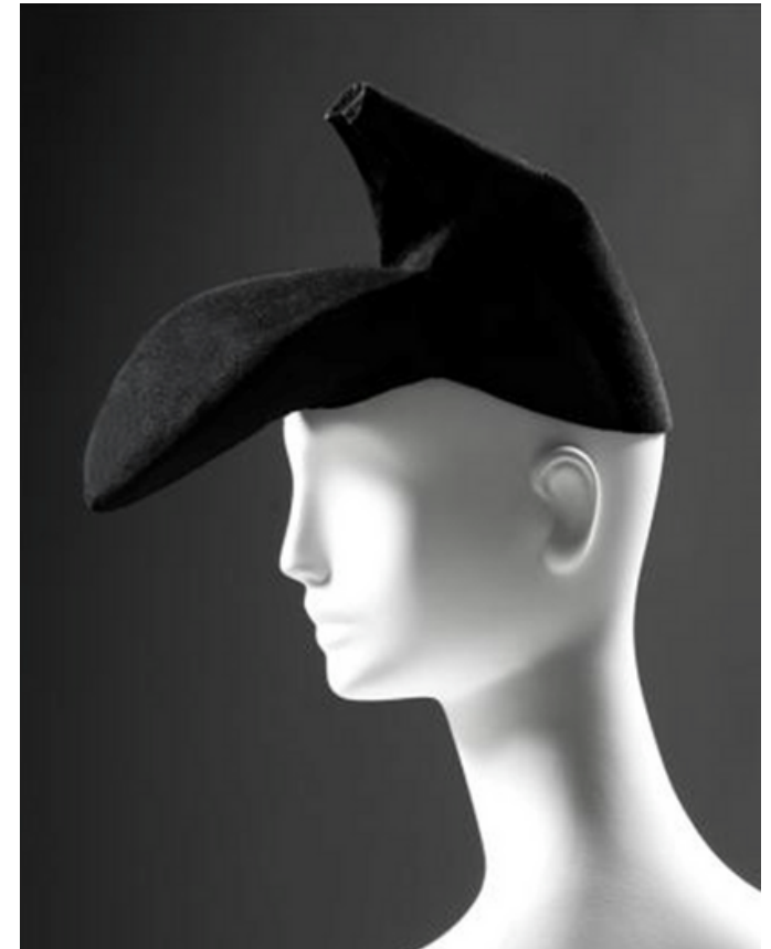
Elsa Schiaparelli, en collaboration avec Salvador Dalí, Chapeau-Chaussure , Hiver 1937-1938, feutre noir, Palais Galleria