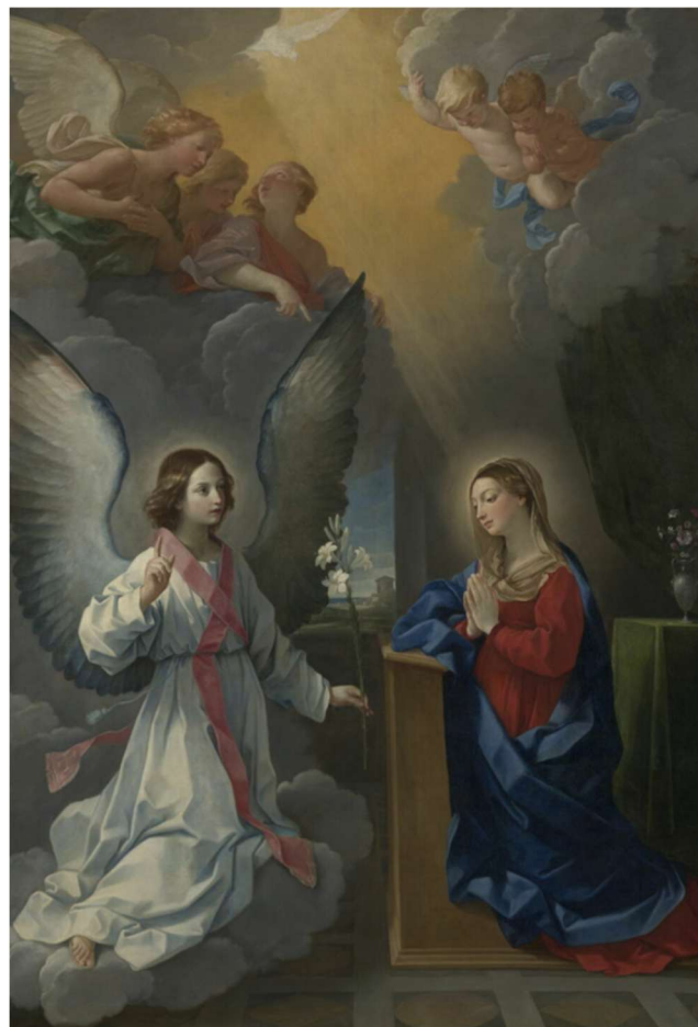
L'Annonciation 1625 / 1650 Guido Reni Aile Denon, Niveau 1 Salle 716