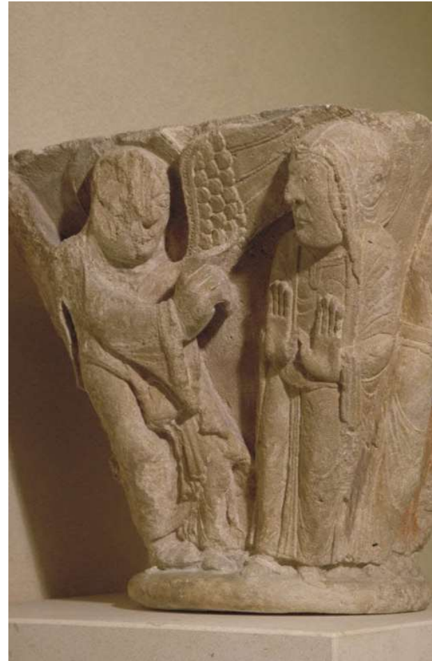
Fragment d'un chapiteau double (?) : l'Annonciation, la Visitation et décor végétal 1125 / 1150 Aile Richelieu, Niveau 0 Salle 202