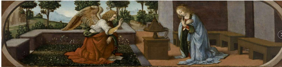
L'Annonciation 1475 / 1500 Lorenzo di Credi Aile Denon, Niveau 1 Salle 709