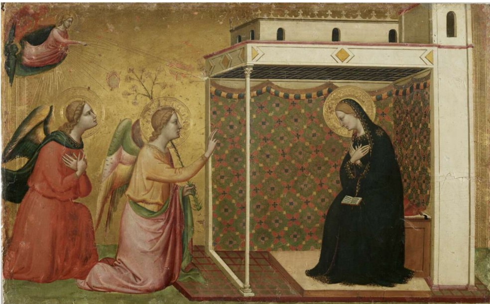
L'Annonciation Vers 1335 Bernardo Daddi Aile Denon, Niveau 1 Salle 708