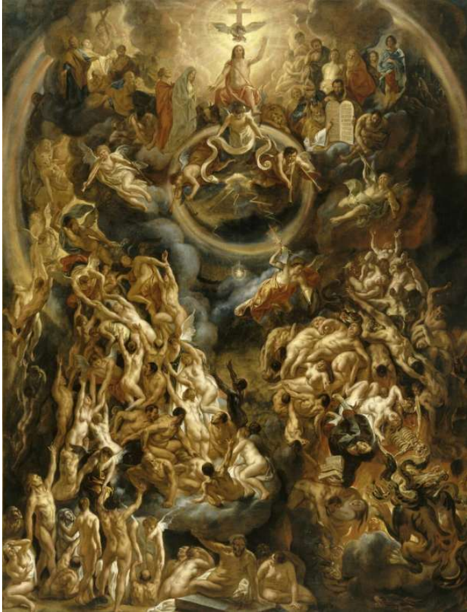
Le Jugement dernier 1653 Jacob Jordaens Aile Richelieu, Niveau 2 Salle 800