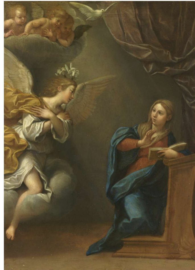
L'Annonciation 1600 / 1700 Francesco Albani Aile Denon, Niveau 1 Salle 716