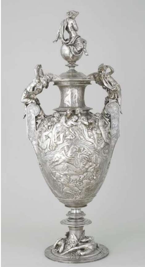
Vase du Paradis Perdu ou de la Création 1848 / 1861 Aile Richelieu, Niveau 1 Salle 563