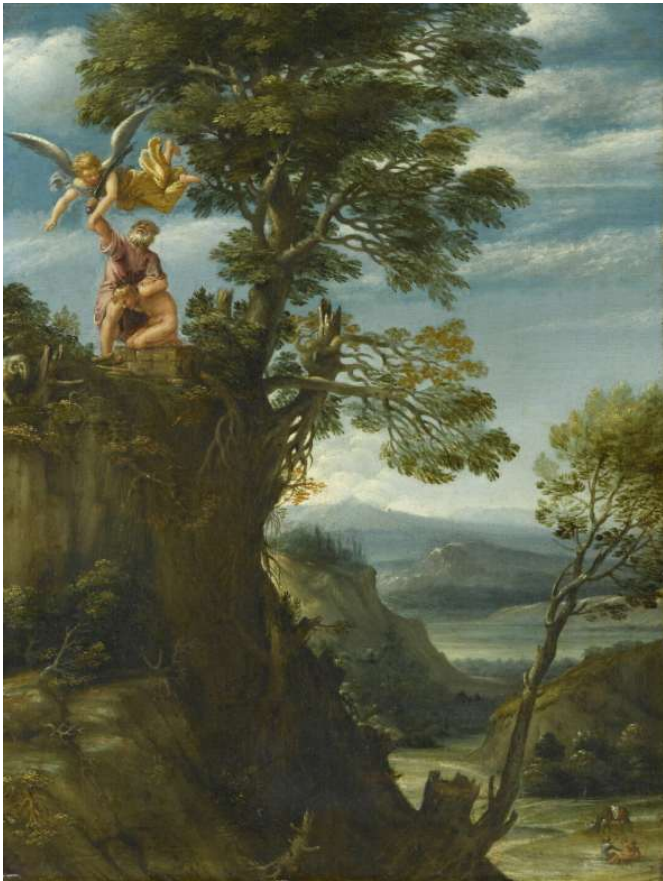
Le sacrifice d'Abraham Annibal Carrache 1575 / 1600 Aile Denon, Niveau 1 Salle 716

Musée du Louvre 75058 Paris Cedex 01 01 40 20 50 50 www.louvre.fr