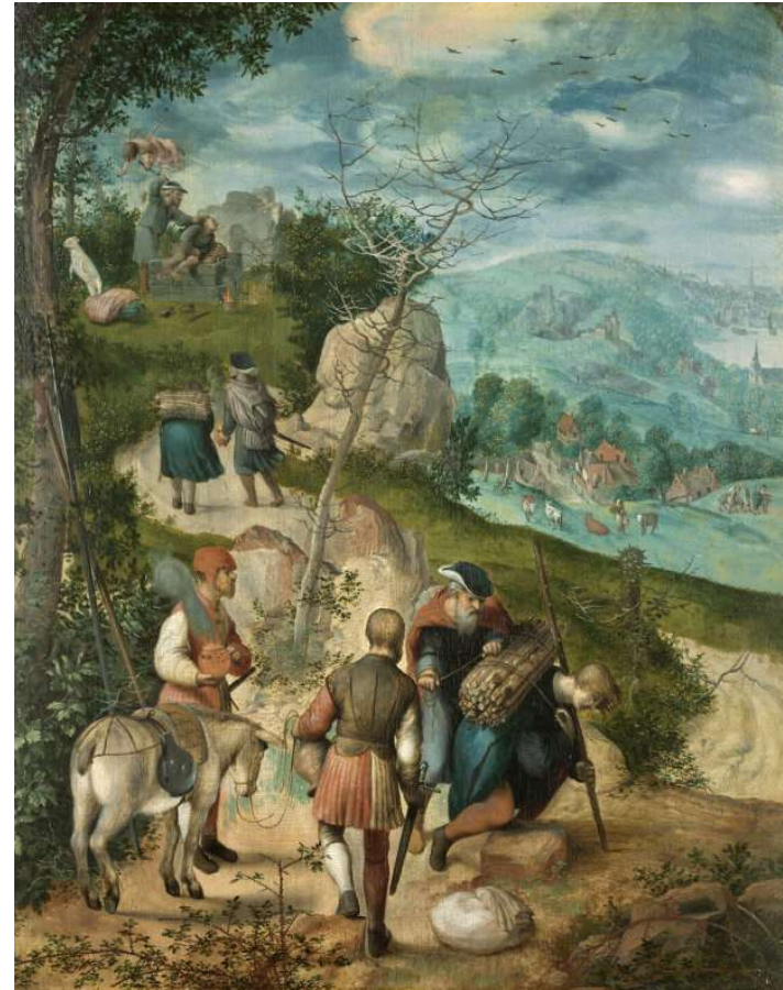
Abraham conduisant son fils Isaac au sacrifice 1500 / 1550 Aile Richelieu, Niveau 2 Salle 814

Musée du Louvre 75058 Paris Cedex 01 01 40 20 50 50 www.louvre.fr