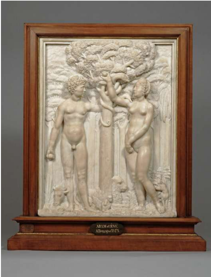
Adam et Eve 1400 / 1600 Aile Denon, Niveau -1 Salle 169

Musée du Louvre 75058 Paris Cedex 01 01 40 20 50 50 www.louvre.fr