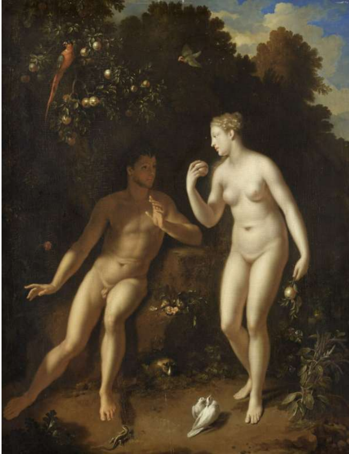
Adam et Ève près de l'arbre du Bien et du Mal 1675 / 1725 Aile Richelieu, Niveau 2 Salle 859