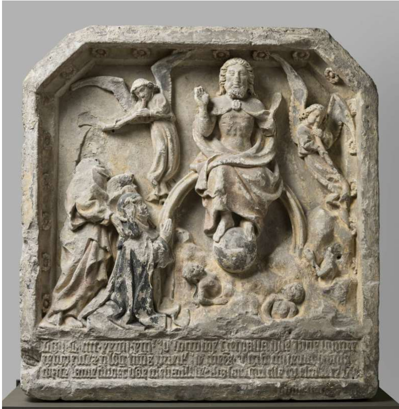
Jugement dernier avec une religieuse agenouillée présentée par saint Jean Baptiste 1425 / 1450