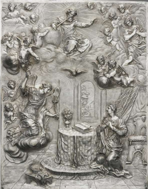
Plaque : L'Annonciation Vers 1690 Johann Andreas Thelott Aile Sully, Niveau 1 Salle 605