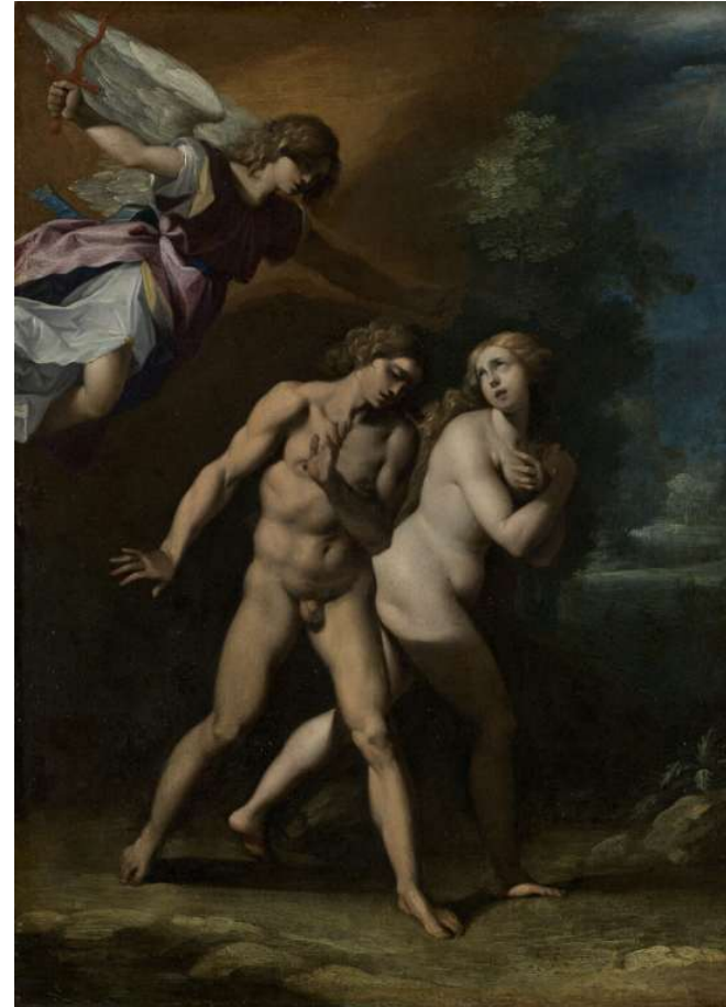
Adam et Eve chassés du paradis terrestre 1570 / 1600 Aile Denon, Niveau 1 Salle 716

Musée du Louvre 75058 Paris Cedex 01 01 40 20 50 50 www.louvre.fr