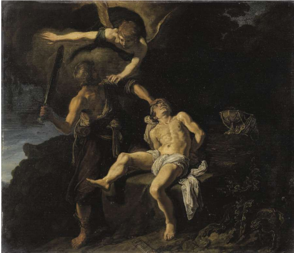
L'Ange du Seigneur empêchant Abraham de sacrifier son fils Isaac