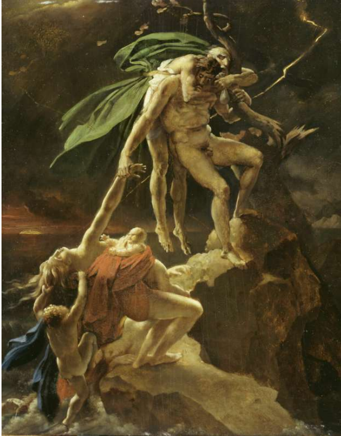
Le Déluge, esquisse