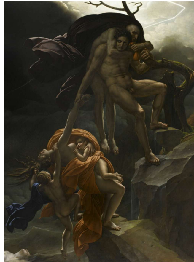
Scène du déluge 1800 / 1825 Anne-Louis Girodet de Roucy-Trison Aile Denon, Niveau 1 Salle 702