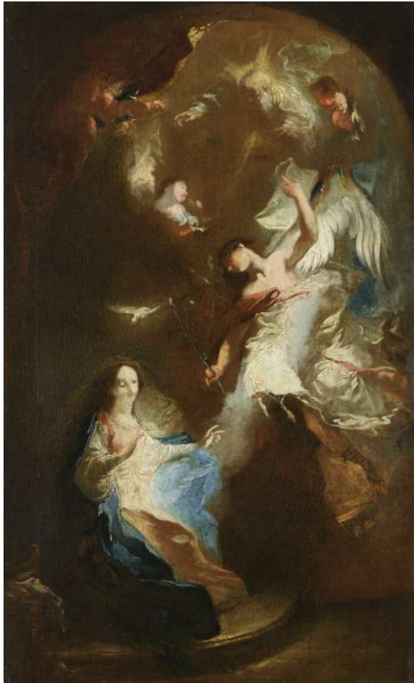
L'Annonciation Vers 1755 Franz Anton Maulbertsch Aile Richelieu, Niveau 2