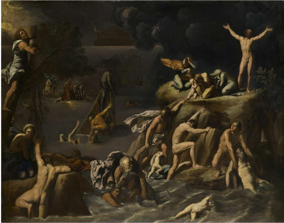
Le Déluge 1600 / 1625 Antoine Carrache Aile Denon, Niveau 1 Salle 716