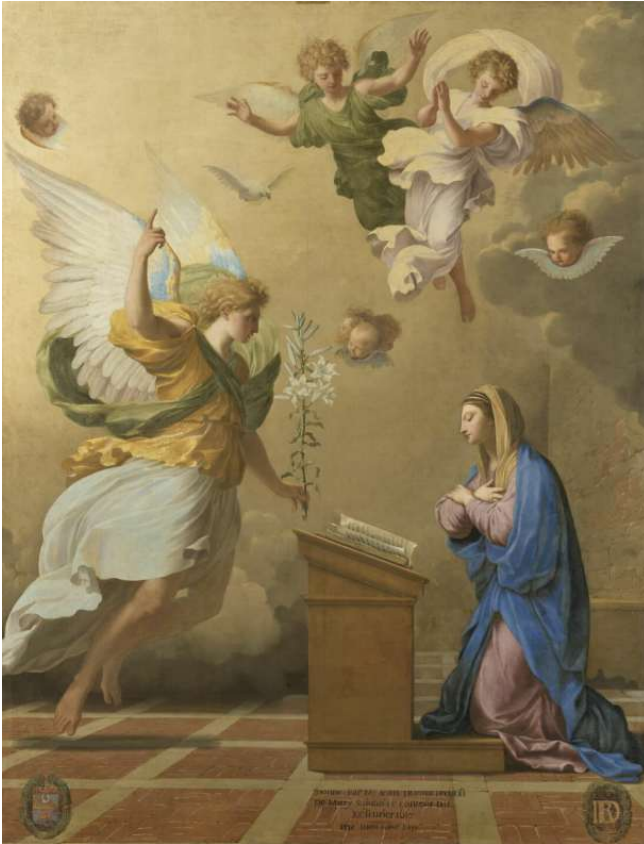
L'Annonciation 1652 Eustache Le Sueur Aile Sully, Niveau 2 Salle 908