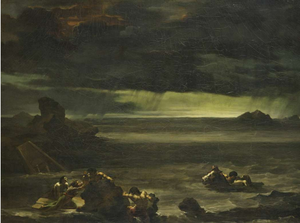
Scène du déluge 1800 / 1825 Théodore Géricault Aile Sully, Niveau 2 Salle 941