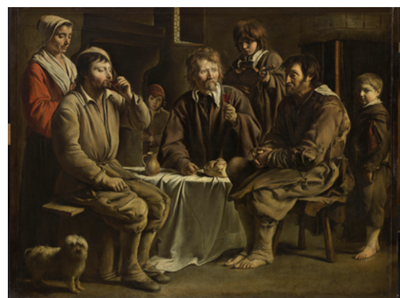
Louis Le Nain, Antoine Le Nain (?), Repas de paysans , 1642, Musée du Louvre, département des Peintures, Paris