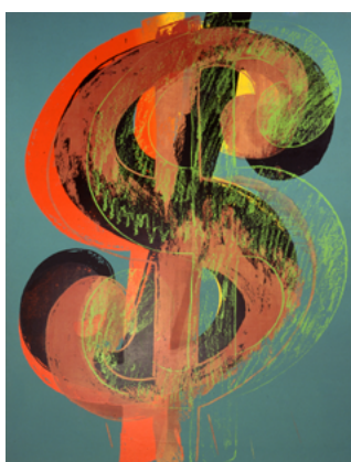
Andy Warhol, Dollar Sign , 1981 Musée d'art moderne et d'art contemporain (MAMAC), Nice