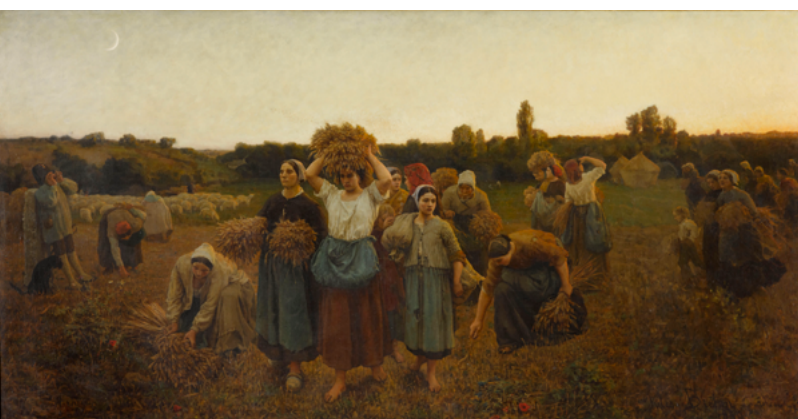
Jules Breton, Le Rappel des glaneuses , 1859 Musée d'Orsay, don de l'Empereur pour le musée du Luxembourg, 1862, Paris