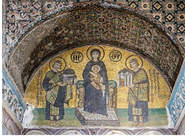
III.2. Mosaïque de la basilique Sainte-Sophie représentant l'empereur Justinien, la Vierge Marie et Constantin 1 er . Cette représentation religieuse est reproduite dans plusieurs manuels scolaires pour les programmes d'histoire de 5 e et de 2 de .