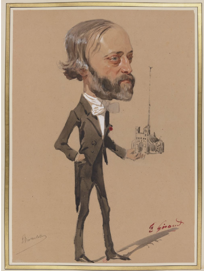
Eugène GIRAUD, Viollet-le-Duc , 1860, dessin, aquarelle avec rehauts de blanc, Les soirées du Louvre , BnF, Paris