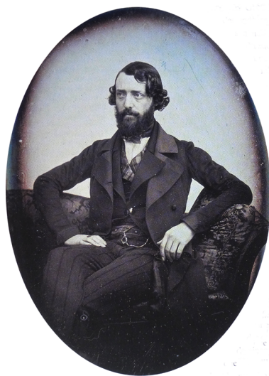
Portrait de Viollet-le-Duc , daguerréotype, 1848, Musée des monuments français.

L'incendie de Notre-Dame de Paris en 2019 et les débats sur la restauration de la flèche ont mis en lumière le rôle majeur d'Eugène Viollet-le-Duc (1814-1879) dans l'identité patrimoniale de la cathédrale. Si la postérité a essentiellement retenu son action de restaurateur de monuments médiévaux, l'œuvre de Viollet-le-Duc, protéiforme, excède cependant la seule intervention sur le bâti préexistant pour aborder le dessin, l'observation de la nature, celle de l'environnement et la création architecturale.