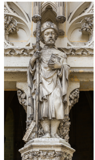
Statue représentant Eugène Viollet-le-Duc en habit de pèlerin de Saint-Jacques de Compostelle , vers 1857, trumeau de la chapelle du château de Pierrefonds.