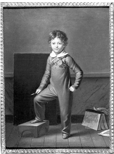
Étienne-Jean DELESCLUZE, Portrait d'Eugène Viollet-le-Duc enfant , 1819, collection particulière.