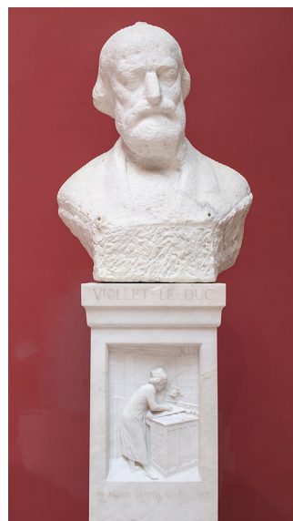
Adolphe-Victor-Geoffroy DECHAUME, Buste d'Eugène Viollet-le-Duc , 1882-1883, marbre, Cité de l'architecture et du patrimoine, Paris.