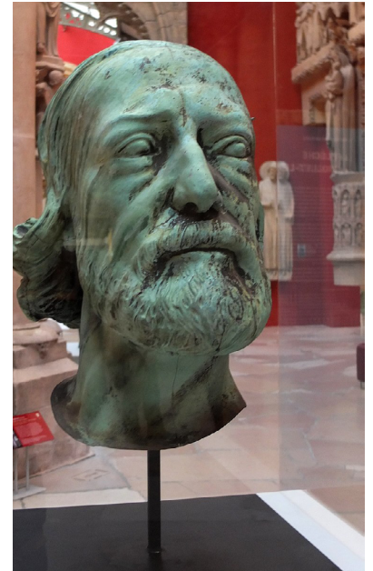
Adolphe-Victor-Geoffroy DECHAUME, Tête de l'apôtre Saint-Thomas sous les traits d'Eugène Viollet-le-Duc , 1860, feuilles de cuivre, H. 60 cm, exposée à la Cité de l'architecture et du patrimoine, Paris.